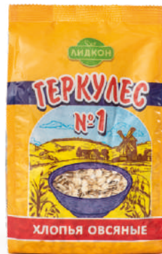
Хлопья овсяные «Геркулес №1»